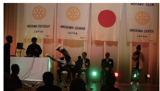
アトラクション(ブレイクダンスショー)