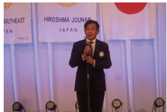
閉会挨拶(三宅副会長)