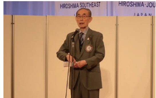
乾杯挨拶(田原会員)