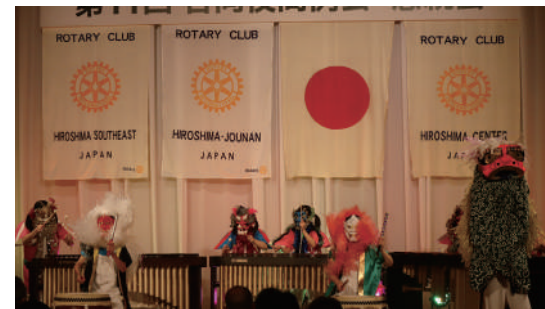
アトラクション(マリンバ演奏)