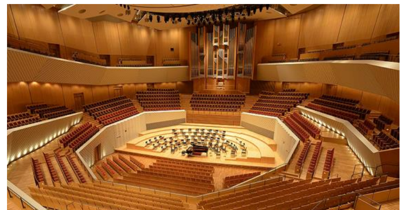
ミュージア川崎シンフォニーホール (川崎市)