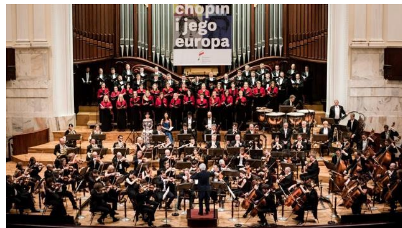
2019年8月17,18日 ポーランド・ワルシャワへの楽団員の派遣公演(5回目)