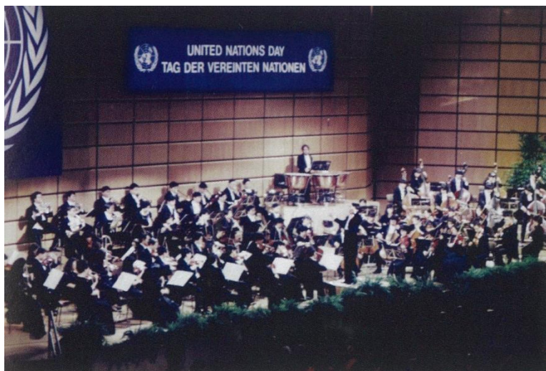
1991年10月25日 ウィーンでの海外初公演