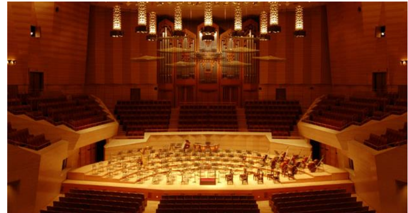
サントリーホール (東京都 港区)