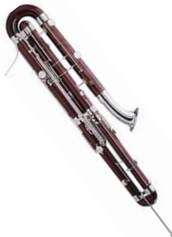
コントラファゴット