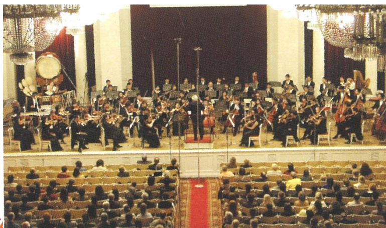
2003年10月17,18日 サントペテルブルグ公演(3回目)