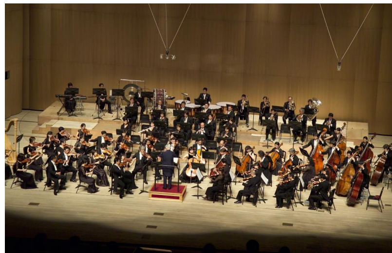
2005年10月19日 韓国公演(ソウル)(4回目)