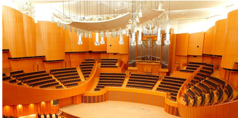
札幌コンサートホール Kitara (札幌市)

コンサートホールも楽器の1つとされています。国際平和文化都市にふさわしく、県民・市民の皆様から誇りとされる交響曲専用ホールの整備が望まれます。