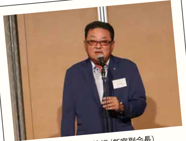
懇親会 乾杯の挨拶(新宮副会長)