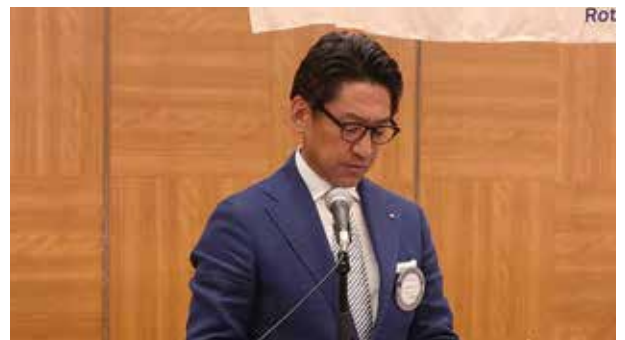
定時総会議長(砂田会長)