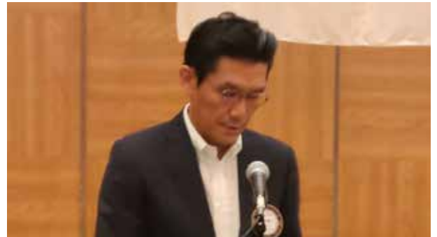
監査報告(好永前年度幹事)